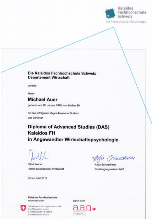
DAS FH in angewandter Wirtschaftspsychologie